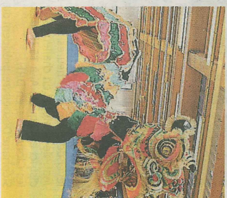
Force et souplesse sous le signe du dragon.