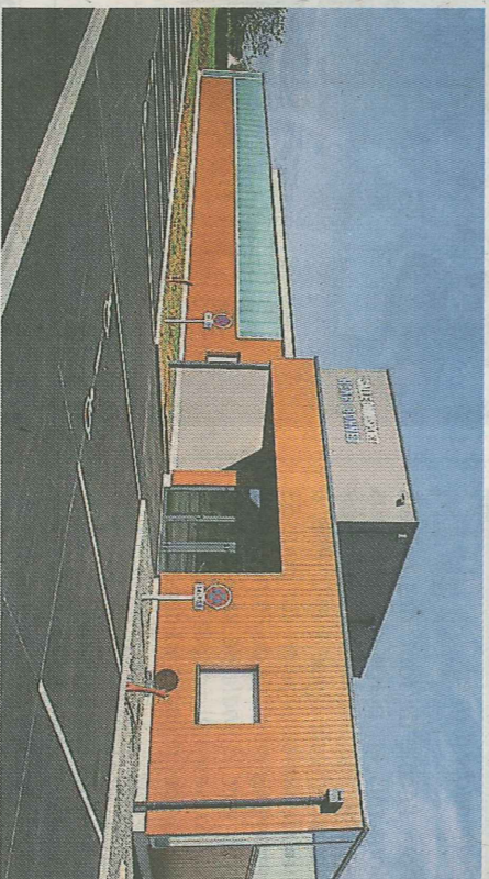
Inaugurée hier, la nouvelle salle de sports est désormais opérationnelle.