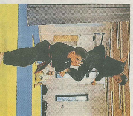
Des démonstrations d'arts martiaux spectaculaires ont enchanté le public.

cloison mobile. L'implantation du bâtiment a été pensée afin d'optimiser le chauffage régulé au moyen d'une chaudière gaz à condensation et des radiants gaz. Les ouvertures sur les façades sud et ouest ont été privilégiées et l'eau chaude sanitaire est produite par 10 m 2 de capteurs solaires en toiture avec un complément au gaz. La salle accueille le dojo d'arts martiaux avec un tatami de 230 m 2 , huit pistes d'escrime métalliques pour la compétition et huit pistes d'entraînement, un mur de tir à l'arc, six vestiaires dont deux réservés aux arbitres, deux bureaux et des locaux de rangement ainsi qu'une infirmerie.