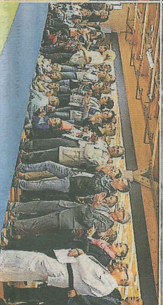
Sablé-sur-Sarthe, salle omnisport Henri-Bonnet, hier. Ruban d'inauguration officiel en présence du sous-préfet, des élus sablois et des enfants d'Henri Bonnet, démonstrations multiples et spectaculaires et public conquis...

d'Europe, vice-championne du monde, quadruple championne de France), ce nouvel espace, conçu avec le concours des instances