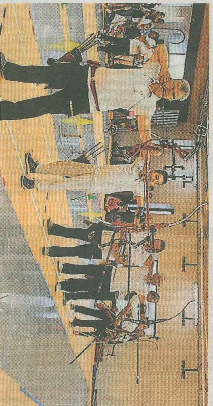
Un pas de tir à l'arc rêvé à 18 mètres...

d'Europe, vice-championne du monde, quadruple championne de France), ce nouvel espace, conçu avec le concours des instances